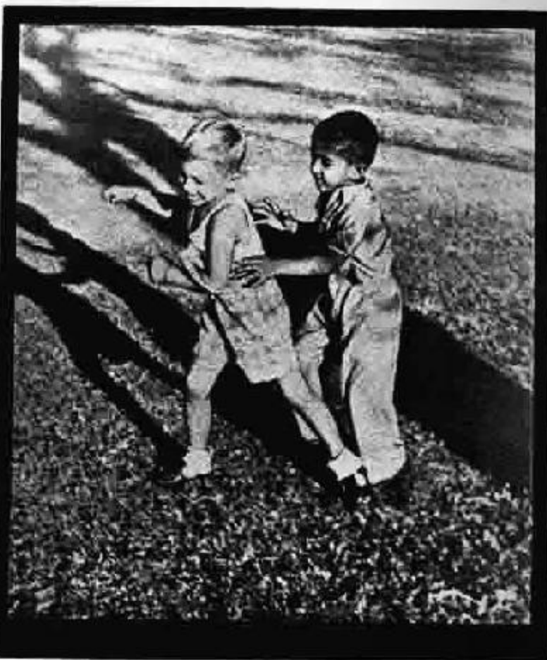
Chandamama Oct. '47